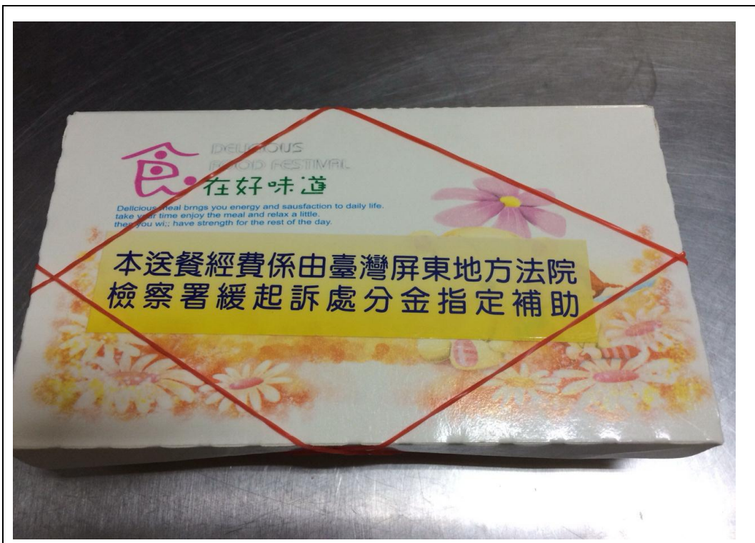
照片說明： 彰顯緩起訴處分金使用之公益性。