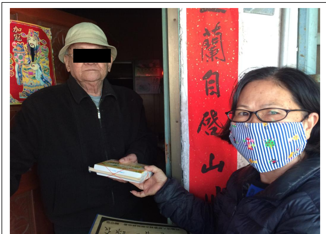
照片說明： 長者心懷感恩接下愛心飯包。