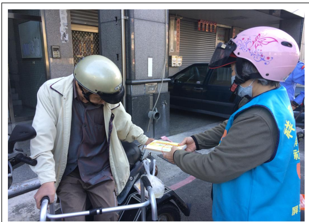
照片說明： 不畏寒流來襲，志工一如往常親送餐盒給長者。