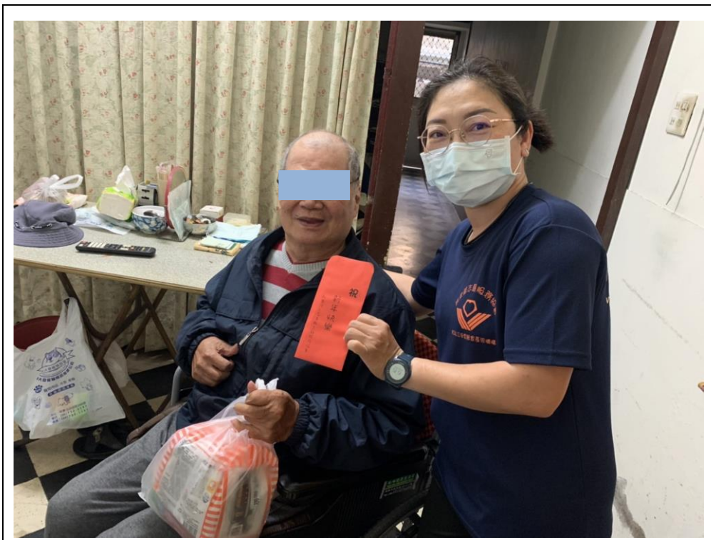
照片說明： 用愛關懷、溫暖到宅 -連結資源發送民生物資。