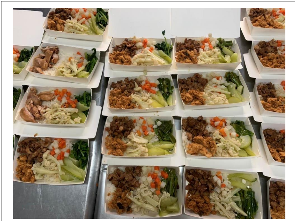
照片說明： 豐盛的便當 ，採少量多樣及營養均衡之搭配。