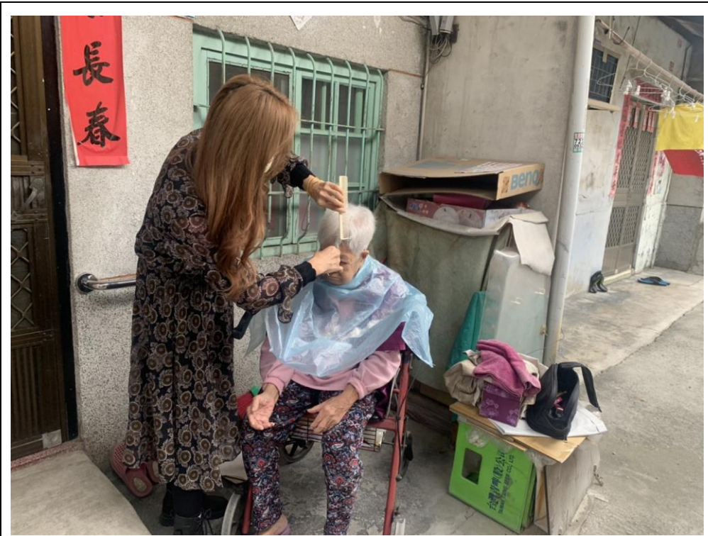
照片說明： 用愛關懷、溫暖到宅-連結資源提供義剪服務。