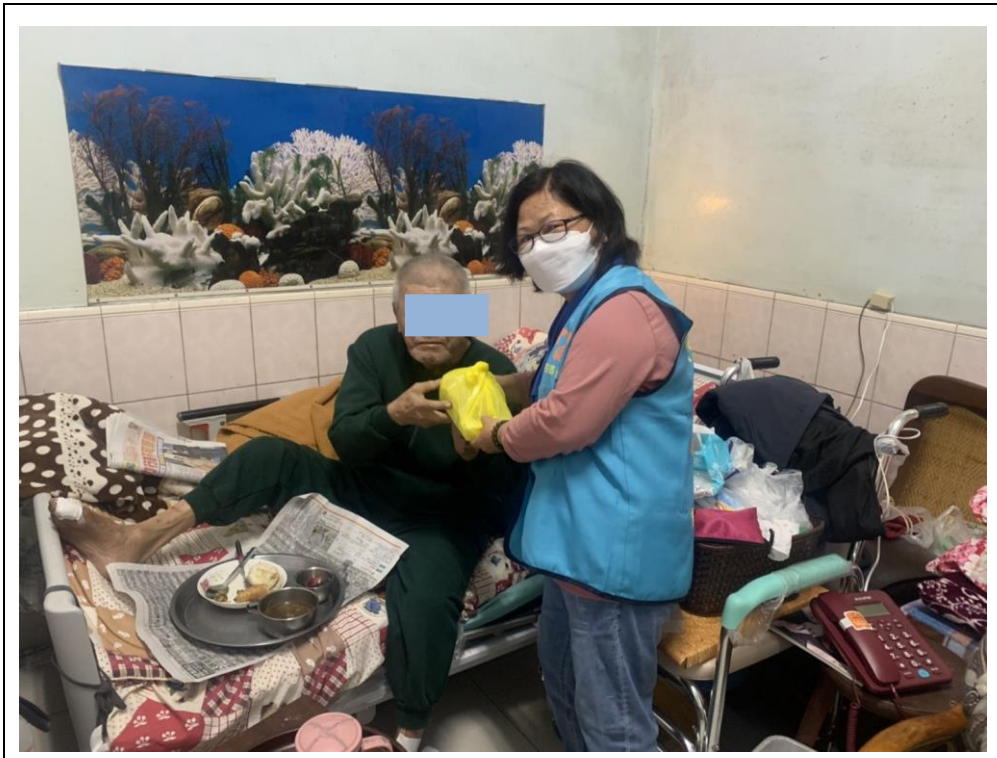
照片說明： 愛要及時 -長者開心收下愛心餐盒。