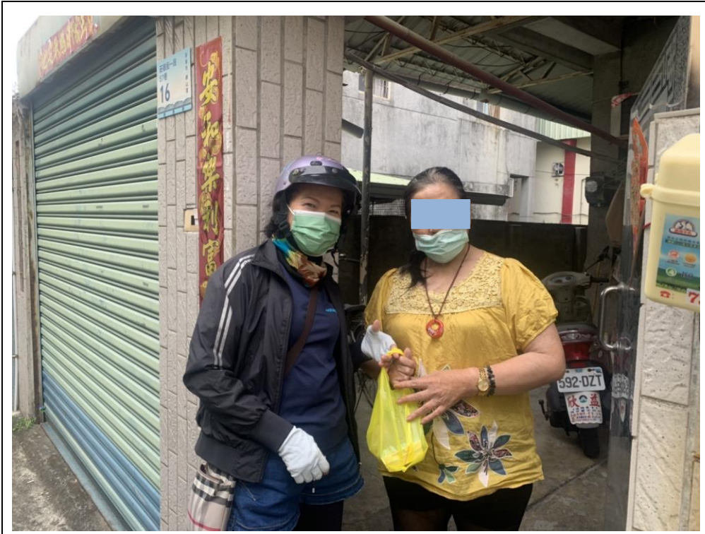
照片說明： 愛要及時-志工將熱騰騰餐盒送至長者手中。